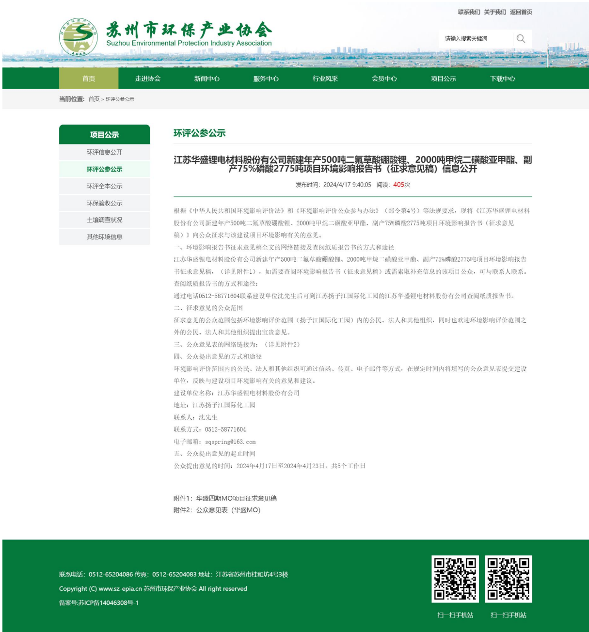
图 3-1 项目环评期间征求意见稿公示网站页面