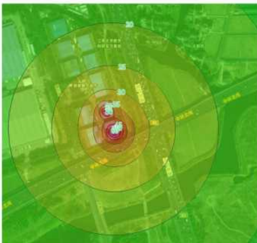
图 6.2-2 噪声贡献情况图 (单位：dB (A))

本次通过采取隔声减振等降噪措施，利用以上预测模式和参数计算确定各主要噪声源通过距离衰减对厂界的噪声贡献情况具体见图 6.2-2，表 6.2-17。