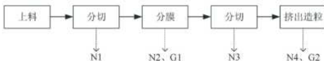
图 4.2-1 生产工艺流程图