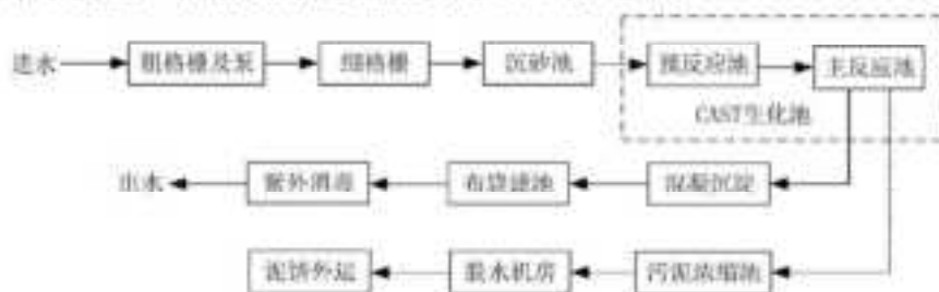
图 6.2-1 浒东水质净化厂工艺流程图

苏州高新水质净化有限公司浒东水质净化厂主体工艺采用“CAST 工艺+混凝沉淀+转盘过滤+紫外消毒”。规划总规模 8 万吨/日，一期设计处理能力 4 万吨/日，于 2008 年开始投运，目前实际处理规模为 1.20 万吨/日。