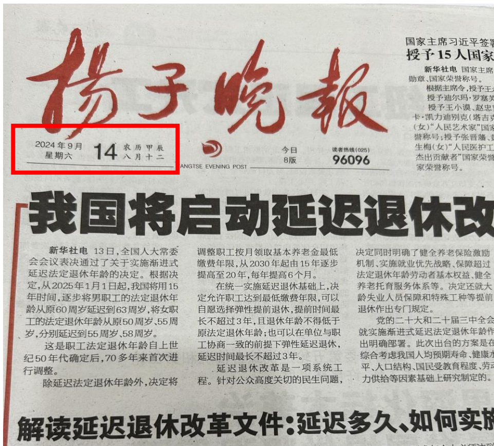
图 2.2-3-1 2024 年 9 月 14 日登报公示照片 (1)