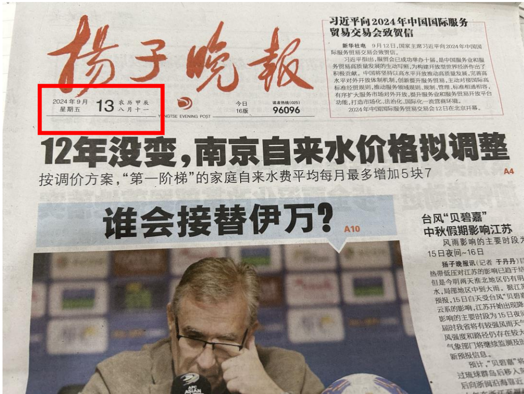
图 2.2-2-1 2024 年 9 月 13 日登报公示照片 (1)