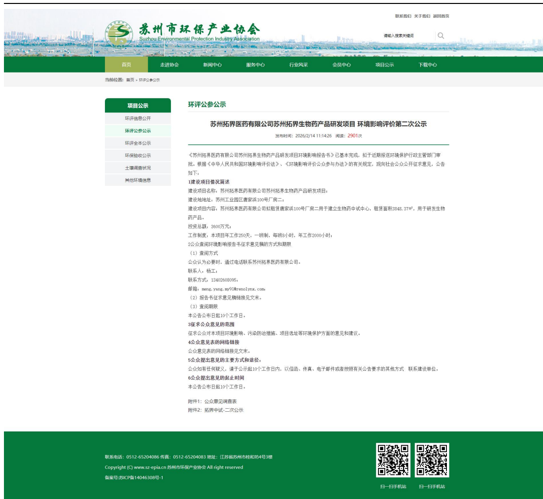
图 3-1 项目环评期间第二次公众参与公示网站页面