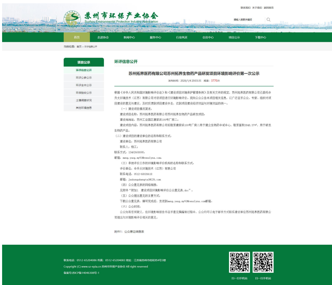
图 2-1 项目环评期间第一次公众参与公示网站页面