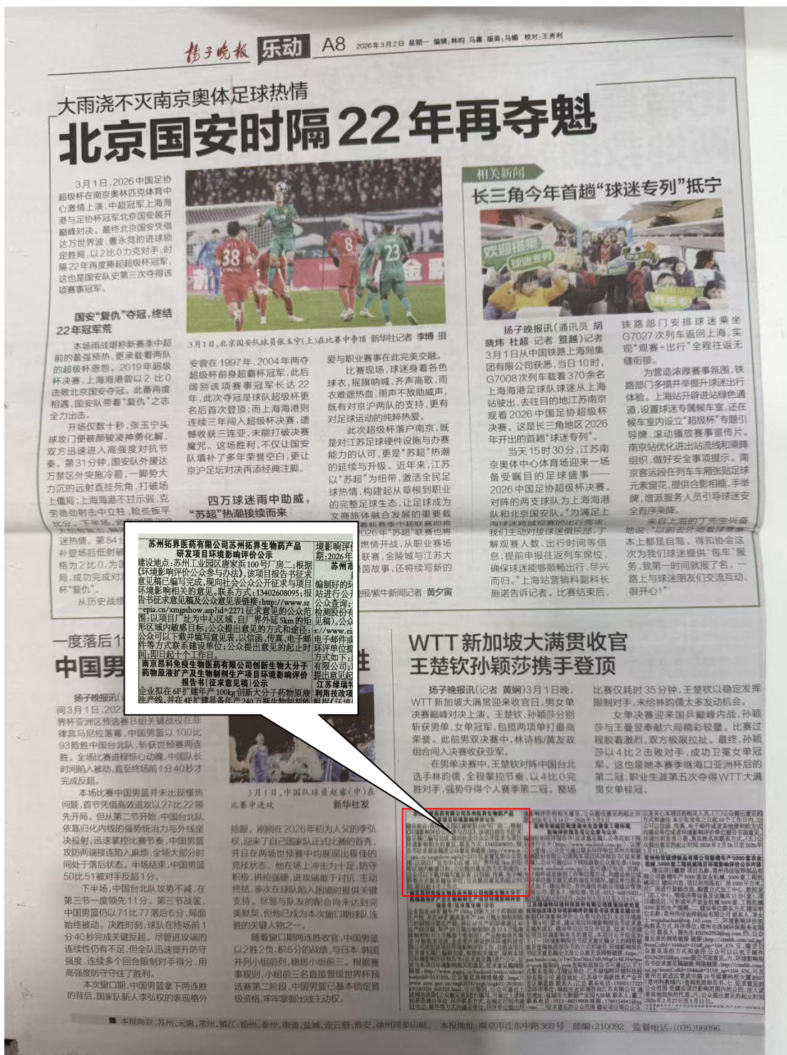
图 3-2 扬子晚报公示内容（第二次登报 2026.03.02）