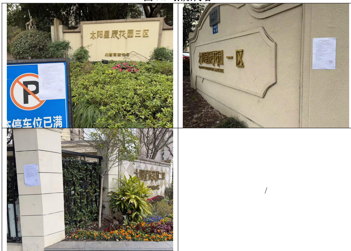
图 3-4 现场张贴公示